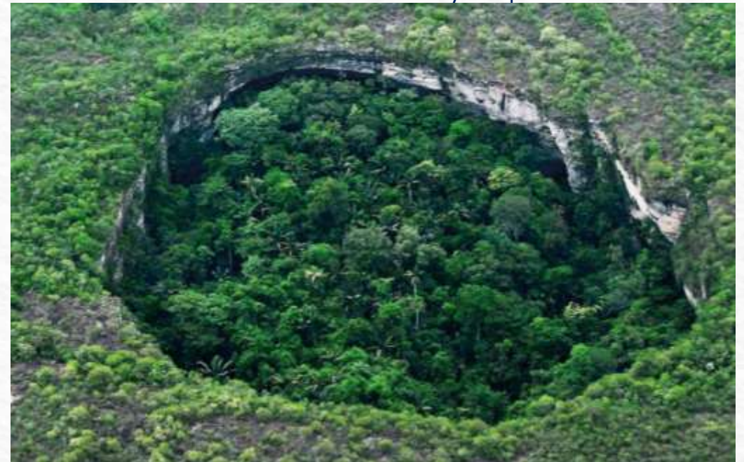
Chiribiquete

Planes de Desarrollo Nacionales y Departamentales.