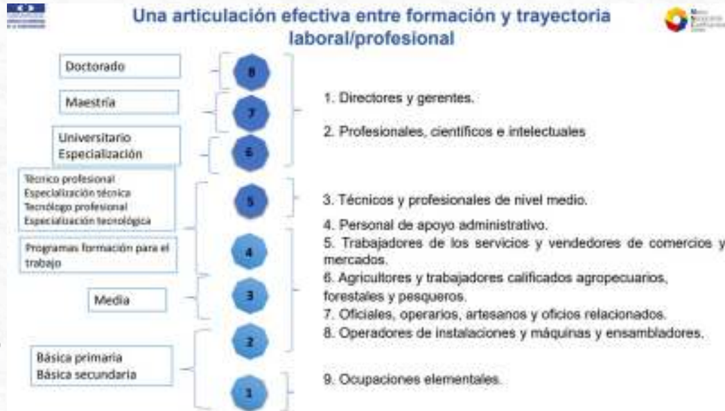
Tabla 1. Ocupaciones CIUO Rev08AC Sector construcción (CAMACOL, 2020)