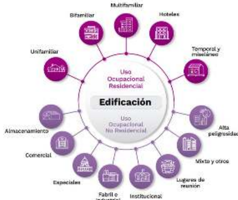
Figura 2. Subsector de edificación