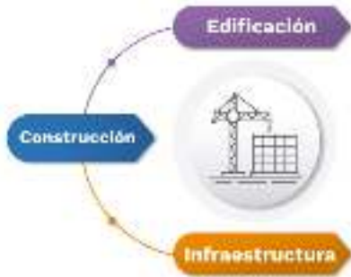
Figura 1. Composición del sector de la construcción