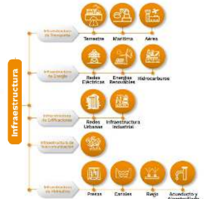
Figura 3. Subsector de infraestructura

Se invita a pensar cómo se puede incorporar en todos estos escenarios de la construcción los enfoques de género y diferencial